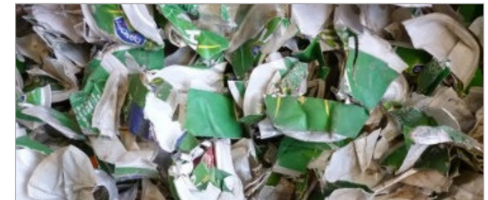
PLA-haltiger Abfall