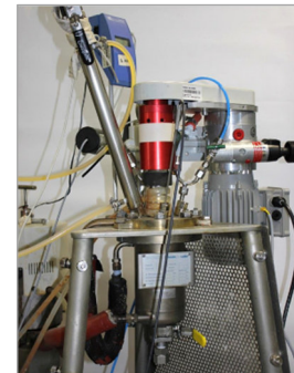
Reaktorsystem zur Herstellung von Dilactid